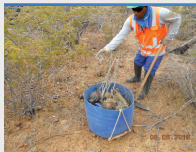
Resgate de Flora