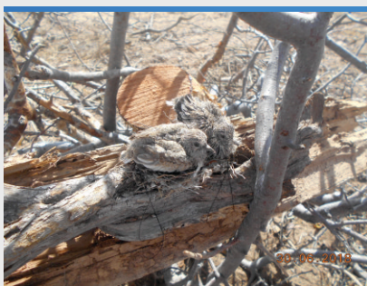
Resgate de Fauna